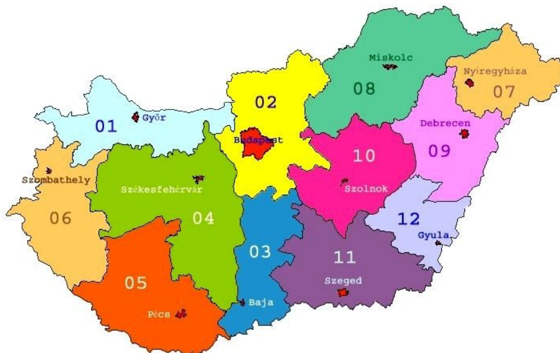
20–2. ábra. A vízügyi igazgatóságok területi elhelyezkedése

A vízügyi igazgatóságok az ország teljes területét lefedik, a legnagyobb (a Közép-Dunántúli VIZIG) területe 12.814 km 2 , a legkisebbé (Körös-vidéki VIZIG) 4.108 km 2 . A területükön elhelyezkedő városok száma: 8-24, községek száma: 41-503. A területükön élő népesség: 296 ezer fő (Körös-vidéki) – 3,3 millió fő (Közép-Duna völgyi).