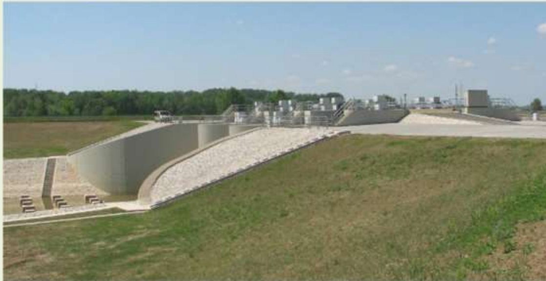
Követendő szép és jó példa: a cigándi tározó

Szándék van, az 1. lépés megtörtént. A megoldás: az új kormány kezében.