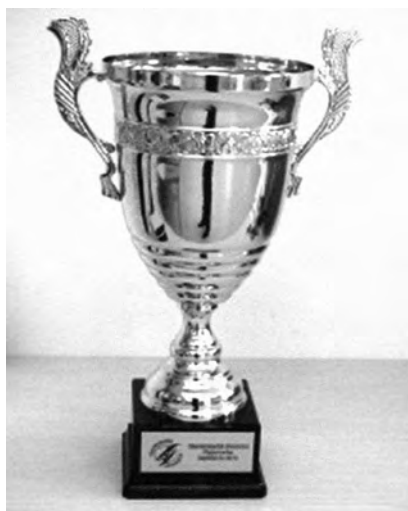
A vándorkupa

A verseny győztes csapatának jutalma a vándorkupa, amely minden évben a nyertesnél marad, és a következő évben adja tovább.