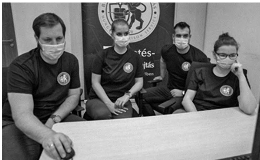
A Büntetés-végrehajtás Országos Parancsnokságának csapata